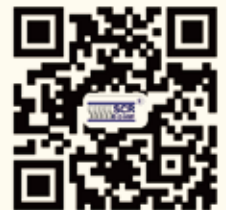
斯可络官方网站二维码

未经过斯可络压缩机（深圳）股份有限公司的事先书面授权，任何组织或个人不得使用文中的有关冠锋产品图片、图标、标识、注册商标、企业名称、网络域名等。