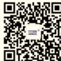
斯可络微信公众号

办公地址：深圳市宝安区新桥街道中心路 102 号时代中心大厦 4G 仓库地址：深圳市宝安区沙井镇岗头路 20 号中亚电子博览中心 联系方式：0755-33116256 传真：0755-33116257 E-mail: sale@scrgd.com 公司网址：www.scrgd.com